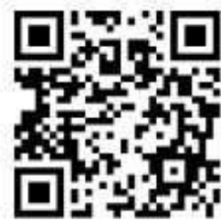
堆肥配布場所 QR コード